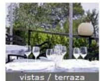
vistas / terraza

destaca su extraordinaria hamburguesa de bisonte