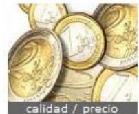
calidad / precio